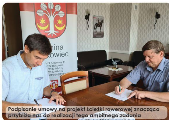
Podpisanie umowy na projekt ścieżki rowerowej znacząco przybliżyło nas do realizacji tego ambitnego zadania

Na zakończenie dodajmy, że nie każda ścieżka ma szansę na budowę ze wsparciem pochodzącym z budżetu Unii Europejskiej. W opracowanym przez