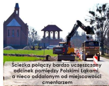
Ścieżka połączy bardzo uczęszczany odcinek pomiędzy Polskimi Łąkami, a nieco oddalonym od miejscowości cmentarzem

To jednak nie koniec dobrych informacji dla miłośników jednośladów. Gmina przygotowuje bowiem projekt budowy ponad 3-kilometrowego odcinka rowerowego biegnącego wzdłuż drogi wojewódzkiej nr 240, z Krupocina do Bramki. Jako, że to element większego planu naszego województwa są duże szanse na zewnętrzne finansowanie tej inwestycji.