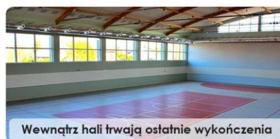
Wewnątrz hali trwają ostatnie wykończenia

Mamy bardzo dobre informacje z naszej największej inwestycji w infrastrukturę sportową i edukacyjną. Wykonawca prowadzi właśnie intensywne roboty przy dokończeniu budowy hali sportowo-widowiskowej zlokalizowanej w sąsiedztwie szkoły w Bukowcu. Aktualnie kontynuowane są prace związane z wykonaniem elewacji budynku oraz dróg komunikacyjnych, na ukończeniu jest wykończenie wnętrza hali. Już wykonano zostały prace instalacyjne i zamontowana została gruntowa pompa ciepła. Roboty wraz z uzyskaniem pozwolenia użytkowania obiektu mają zakończyć się w najbliższych kilku tygodniach. Jednocześnie trwają zakupy niezbędnego wyposażenia, w tym sprzętu sportowego – wszystko po to, aby od razu uczniowie i sportowcy mogli zacząć w pełni korzystać z możliwości hali. Przypomnijmy, że po uruchomieniu hala ma służyć nie tylko uczniom na lekcje wychowania fizycznego, ale także na popołudniowe zajęcia dla dzieci, młodzieży i dorosłych: sekcjom klubów sportowych, czy wychowankom świetlicy środowiskowej.