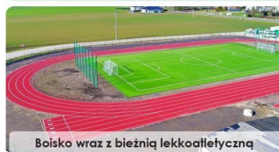
Boisko wraz z bieżnią lekkoatletyczną

Oczywiście hala będzie wykorzystywana do organizacji gminnych imprez i uroczystości.