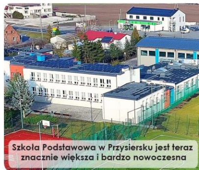
Szkoła Podstawowa w Przysiersku jest teraz znacznie większa i bardzo nowoczesna