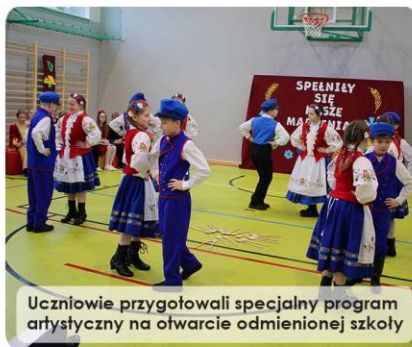
Uczniowie przygotowali specjalny program artystyczny na otwarciu odnowionej szkoły