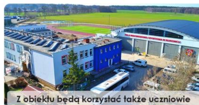
Z obiektu będą korzystać także uczniowie