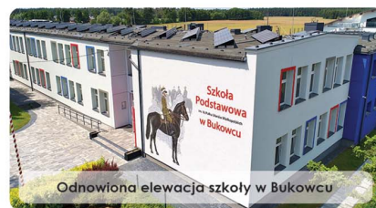
Odnowiona elewacja szkoły w Bukowcu

wał wykonanie podbudowy i wierzchniej warstwy asfaltowej. Równocześnie przez kilka miesięcy realizowano roboty na odcinkach dróg gminnych - w Gawrońcu, Plewnie, pomiędzy Polskimi Łąkami a Gawrońcem, a także przy ul. Wiatrakowej w Bukowcu i przy ul. Brzózki w Przysiersku. W każdej z tych lokalizacji zakres prac obejmował wykonanie nowych asfaltowych dywaników.