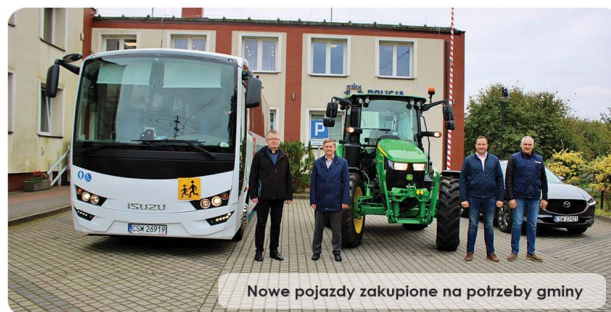
Nowe pojazdy zakupione na potrzeby gminy

Mieszkańcy Polskich Łąg i najbliższej okolicy cieszą się natomiast ze ścieżki pieszo-rowerowej, która prowadzi od skrzyżowania z drogą gminną w centrum miejscowości aż do istniejącego chodnika przy cmentarzu parafialnym. Asfaltowa ścieżka ma 2 m szerokości, a została zaprojektowana przez naszą gminę we współpracy z powiatem. Za nami także udany remont odcinka drogi powiatowej Budyń - Jarzębieniec w sołectwie Budyń. Zadanie obejmo-