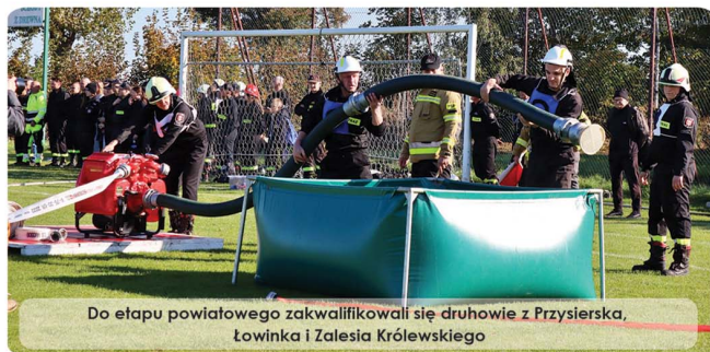
Do etapu powiatowego zakwalifikowali się druchowie z Przysierska, Łowinka i Zalesia Królewskiego

Dodajmy, że naszą gminę reprezentowały wpisane do Krajowego Systemu Ratowniczo-Gaśniczego jednostki z Bukowca oraz z