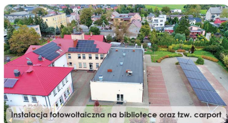
Instalacja fotowoltaiczna na bibliotece oraz tzw. carport

W maju zakończono budowę kompleksu sportowo - rekreacyjnego przy szkole w Bukowcu. Powstała bieżnia lekkoatletyczna i boisko ze sztuczną nawierzchnią. Prócz tego wykonano niezbędne zagospodarowanie terenu i instalację fotowoltaiczną oraz odnowiono elewację budynku szkoły.