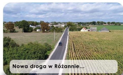
Nowa droga w Różannie...

Nowy asfalt cieszy też mieszkańców Plewna. W tym przypadku firma drogowa wybudowała 300-metrowy odcinek w zwartej zabudowie mieszkaniowej. To fragment polnej drogi od skrzyżowania przy świetlicy wiejskiej w Plewnie w kierunku Przysierska. Ogłoszenie przetargowe przewidywało ponadto wykonanie odcinka próbnego. Na asfalt w Plewnie, prócz środków finansowych z budżetu gminy, nasi urzędnicy pozyskali 50-procentowe