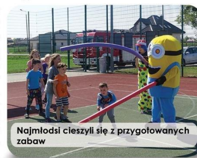
Najmłodszy cieszyli się z przygotowanych zabaw

Długi majowy weekend upłynął w naszej gminie pod znakiem sportu, zabawy i promocji zdrowego odżywiania. Wiele emocji wywołały rozgrywki w piłkę nożną - do rywalizacji przystąpiło kilkanaście