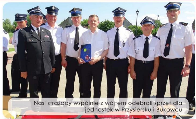
Nasi strażacy wspólnie z wójtem odebrali sprzęt dla jednostek w Przysiersku i Bukowcu