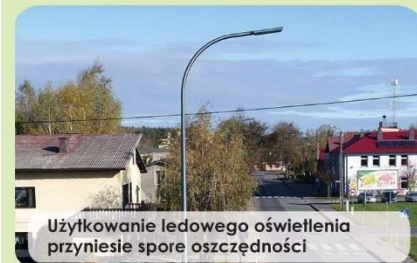
Użytkowanie ledowego oświetlenia przyniesie spore oszczędności

Ponad 600 tys. zł kosztował montaż ledowego oświetlenia ulic w Bukowcu. Nowe lampy są nie tylko energooszczędne, ale też bardzo estetyczne.