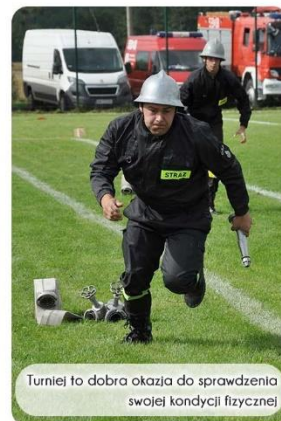
Turniej to dobra okazja do sprawdzenia swojej kondycji fizycznej