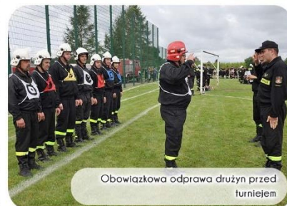
Obowiązkowa odprawa drużyn przed turniejem