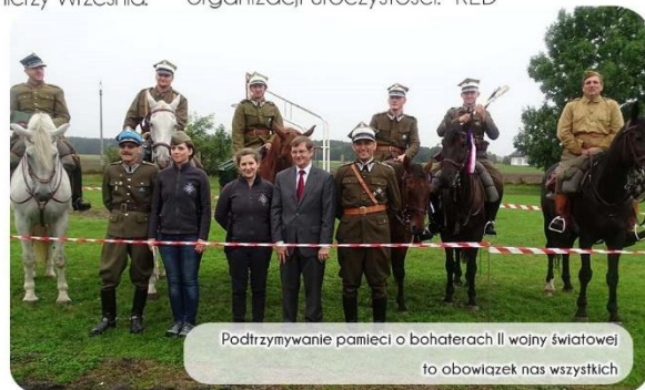
Podtrzymywanie pamięci o bohaterach II wojny światowej to obowiązek nas wszystkich

pokazami grup rekonstrukcyjnych z różnych okresów historycznych. Dużym zainteresowaniem cieszył się przede wszystkim występ kaskaderów „Apolinarski Group”, wykonujących pokazy ułańskie, pokazy woltżerki kozackiej oraz western. Wiele emocji przyniósł także kolejny już „Turniej o szablę przechodnią wójta gminy Bukowiec”. Podczas części pokazowej mieszkańcy chętnie raczyli się ciepłymi napojami i gorącą grochówką. Należy podkreślić, że obchody objął patronatem honorowym Minister Obrony Narodowej. Ponadto samorządowcy dziękują za wsparcie wszystkim, którzy przyczynili się do organizacji uroczystości. RED