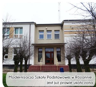
Modernizacja Szkoły Podstawowej w Różannie jest już prawie ukończona

Gdy nadejdzie ten niesamowity Wigilijny Wieczer niech nadzieja i radość zastukają do Waszych drzwi, a Nowy 2018 Rok niech przynosi pomyślność i szczęście każdego dnia.