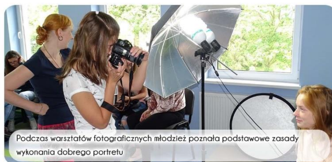
Podczas warsztatów fotograficznych młodzież poznała podstawowe zasady wykonania dobrego portretu

Pierwsze ze spotkań w ramach przedsięwzięcia odbyło się w czerwcu i miało charakter rekrutacyjny. Wzięła w nim udział młodzież gimnazjalna z terenu gminy oraz seniorzy i przedstawiciele Stowarzyszenia Promocji i Rozwoju