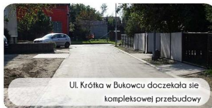
Ul. Krótka w Bukowcu doczekała się kompleksowej przebudowy