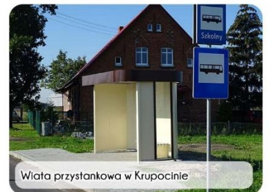
Wiaty przystankowa w Krupocinie

Sołectwo w Korytowie swoje środki zdecydowało przeznaczyć na zagospodarowanie i utwardzenie terenu pod organizację wiejskich imprez i uroczystości. Z kolei w Bramce zaplanowano rozbudowę oświetlenia, w Polednie remont chodnika i położenie kostki przy świetlicy, a w Polskich Łąkach i Tuszyńkach zagospodarowanie terenu przy świetlicy.