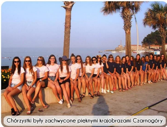
Chórystki były zachwycone pięknymi krajobrazami Czarnogóry

Działający przy szkole w Korytowie chór Kantyczka jak co roku wziął udział w zagranicznym przeglądzie. Tym razem jego członkowie wyjechali na Międzynarodowy Festiwal Folkloru, Tańca i Pieśni do Czarnogóry.