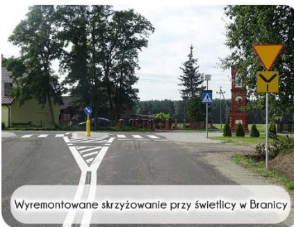
Wyremontowane skrzyżowanie przy świetlicy w Branicy

Gmina przygotowała też kolejne projekty, które mają zostać wykonane w 2018 roku – to trzy odcinki dróg w Korytowie oraz drugi etap remontu ulicy Leśnej w Bukowcu. W ten sposób konsekwentnie realizowany jest plan prac nakreślony przez radę gminy. RED