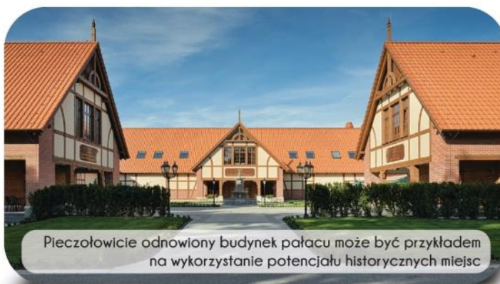
Pieczolowicie odnowiony budynek pałacu może być przykładem na wykorzystanie potencjału historycznych miejsc