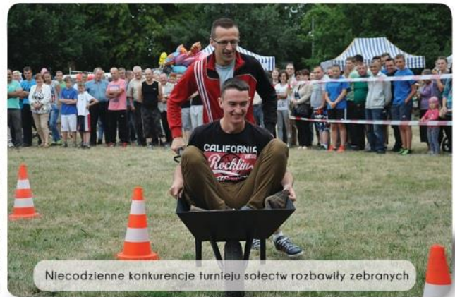
Niecodzienne konkurencje turnieju sołectw rozbawiły zebranych

drużyn – Polskie Łąki, Korytowo, Tuszyńki, Cawroniec, Plewno, Różanna, Budyń, Przysiersk i Krupocin). Po zakończeniu rywalizacji najwięcej punktów zebrano sołectwo Przysiersk, drugie miejsce na podium przypadło sołectwu Plewno, trzeci był Krupocin. Po zakończeniu rywalizacji zgromadzona publiczność w y s t u c h a ł a