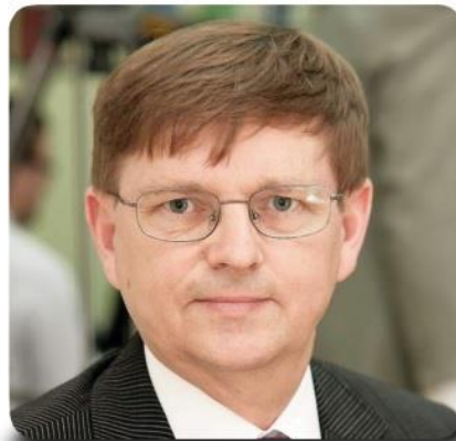
Wójt Licznerski nie kryje radości z dobrych ocen wystawionych naszej gminie. – To zasługa pracy całego urzędu i przemyślanych decyzji naszych radnych – mówi.