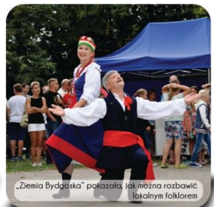
„Ziemia Bydgoska” pokazała, jak można rozbawić lokalnym folklorem