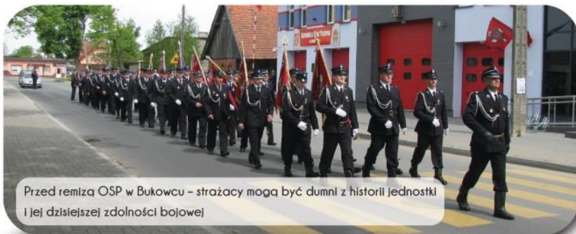
Przed remizą OSP w Bukowcu – strażacy mogą być dumni z historii jednostki i jej dzisiejszej zdolności bojowej

Z tej okazji spotkali się druhowie Ochotniczych Straży Pożarnej naszej gminy, a także zaprzyjaźnione jednostki z Drzycimia, Pruszczu, Gruczna, Świekatowa, Przechowa, Lniana, Siemkowa i Świecia. Licznie zgromadzeni mieszkańcy i przybyli goście najpierw udali się do kościoła parafialnego w Bukowcu, gdzie odbyła się msza św. w intencji druhow. Po wspólnej modlitwie kolumną prowadzoną przez orkiestrę dętą jednostki OSP