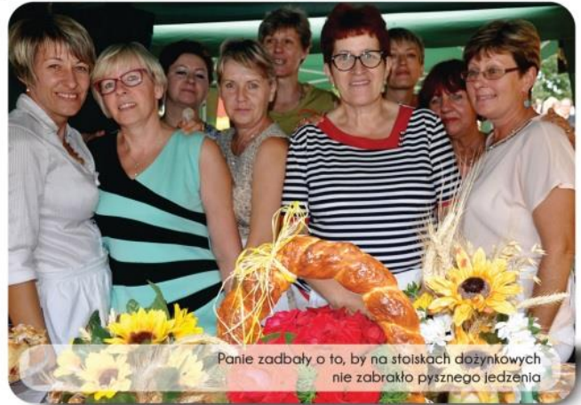
Panie zadbały o to, by na stoiskach dożynkowych nie zabrakło pysznego jedzenia