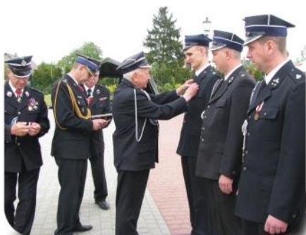
Jubileusz stał się okazją do wręczenia medali i odznaczeń