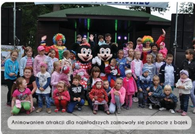
Animowaniem atrakcji dla najmłodszych zajmowały się postacie z bajek

recitalu Suzanny Rahman. Na zakończenie obchodów do tańca przygrywał zespół Rolantic. W trakcie imprezy w parku mieszkańcy mogli spróbować potraw i wypieków Kół Gospodyń Wiejskich z Bukowca, Korytowa, Polskich Łąg, Gawronica oraz Tuszynek. W tym roku także mogliśmy posmakować wędlin pana Raguzy z Przysierska, a jak zawsze sporym powodzeniem cieszyła się tradycyjna grochówka. RED