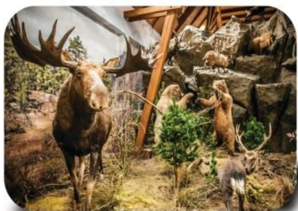
Wystawa, którą można obejrzeć w Polednie przyciąga turystów z całego kraju