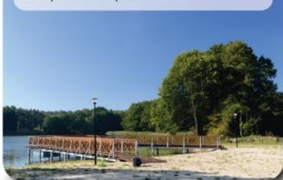
Niezwykle urokliwa plaża

Czesław Wszolek oraz prezes Lokalnej Grupy Działania Zdzisław Plewa. Zaraz po wystąpieniach nastąpiło przecięcie wstęgi. Powstanie terenu rekreacyjnego w Branicy było możliwe dzięki pozyskaniu przez gminę Bukowiec dofinansowania unijnego udzielonego za pośrednictwem Lokalnej Grupy Działania. Mowa o kwocie ok. 400 tys. zł. RED