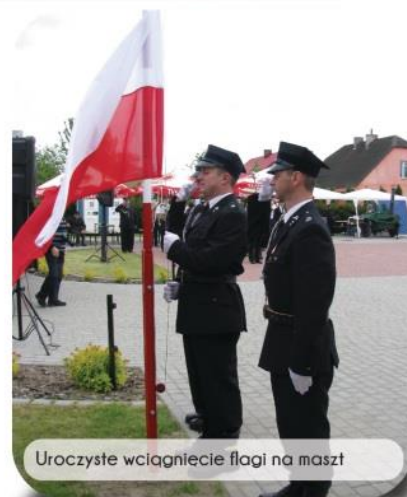
Uroczyste wciągnięcie flagi na maszt