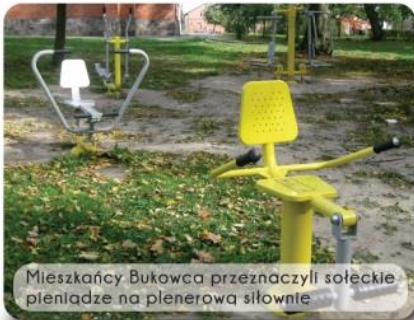
Mieszkańcy Bukowca przeznaczili sołeckie pieniądze na plenerowa siłownię

Uruchomiony kilka lat temu w naszej gminie fundusz sołecki sprawdza się znakomicie. Dlatego możemy spodziewać się kontynuacji tego rozwiązania.