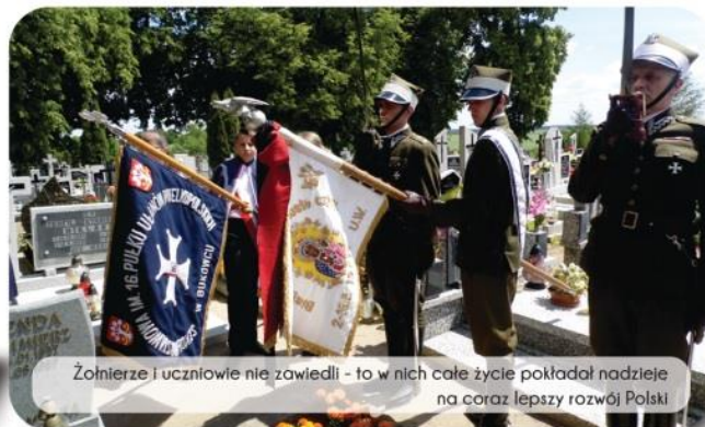
Żołnierze i uczniowie nie zawiedli - to w nich całe życie pokładał nadzieje na coraz lepszy rozwój Polski