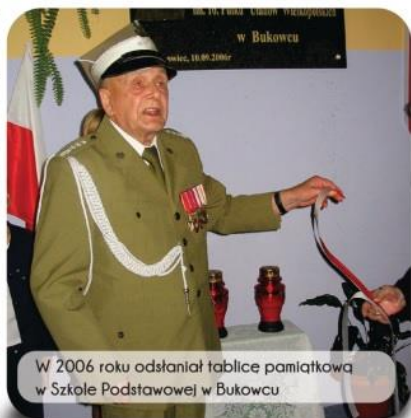
W 2006 roku odsłaniał tablicę pamiątkową w Szkole Podstawowej w Bukowcu