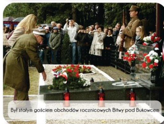
Był stałym gościem obchodów rocznicowych Bitwy pod Bukowcem