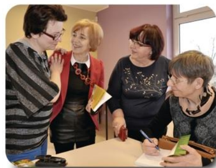
Po spotkaniu autorka wpisywała dedykacje i autografy