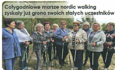
Cotygodniowe marsze nordic walking zyskały już grono swoich stałych uczestników