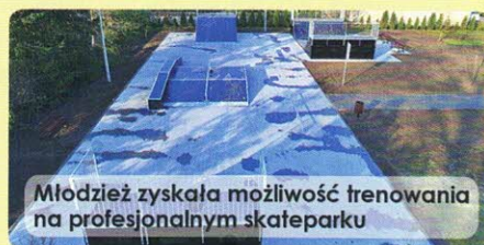
Młodzież zyskała możliwość trenowania na profesjonalnym skateparku