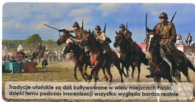
Tradycje ułańskie są dziś kultywowane w wielu miejscach Polski, dzięki temu podczas inscenizacji wszystko wygląda bardzo realnie

Najbardziej widowiskowa okazała się oczywiście inscenizacja histo-