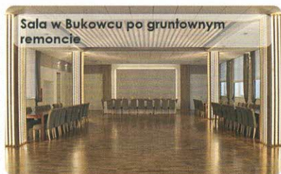
Sala w Bukowcu po gruntownym remoncie