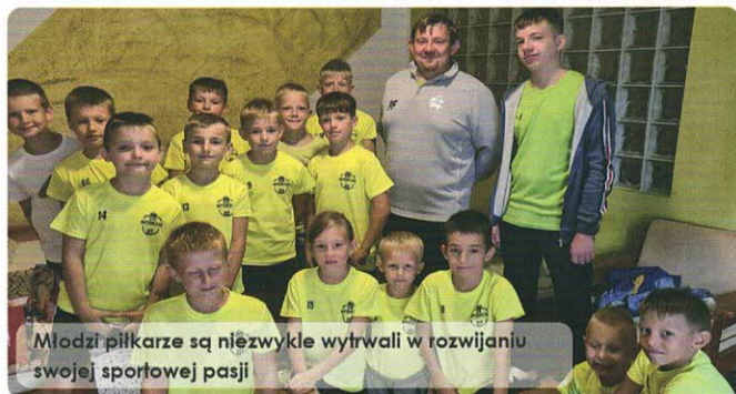
Młodzi piłkarze są niezwykle wytrwali w rozwijaniu swojej sportowej pasji

Piotr Fiutak największe sukcesy odniósł w pracy z młodzieżą z reprezentacji województwa kujawsko-pomorskiego U-12. Zdobył wówczas złoty medal Mistrzostw Polski. Wszystkich zainteresowanych uczęszczaniem na treningi zapraszamy po informację pod nr tel. 691 706 001. RED