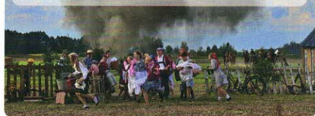
W inscenizacji wystąpili również mieszkańcy Bukowca