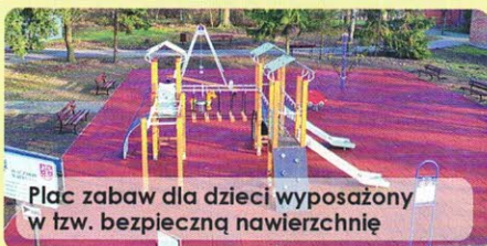
Plac zabaw dla dzieci wyposażony w tzw. bezpieczną nawierzchnię

wynikają z ankiet zebranych od mieszkańców. Informacje, jak ma wyglądać ostateczny zakres inwestycji zgromadzono w trakcie ogłoszonego kilka miesięcy temu plebiscytu. – To przecież infrastruktura dla mieszkańców, tych najmłodszych, młodych i starszych, więc naturalnym było zapytać, jakie są rzeczywiste oczekiwania – wyjaśnia wójt Licznarski. – Mam nadzieję, że dzięki temu udało się nie tylko spełnić większość z nich, ale również zaszczerpić poczucie odpowiedzialności za stan parku i jego infrastruktury. RED