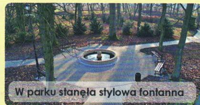
W parku stanęła stylowa fontanna

Należy zauważyć, że całość zmian to nie „widzimisię” urzędników czy radnych. Wszystkie zrealizowane elementy